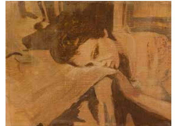
Onder: Hold on, 30 x 40 cm, 2010 (private collection)