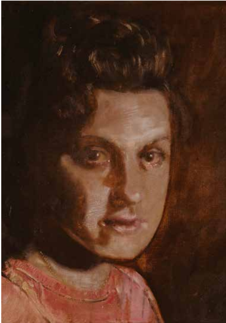
Embrace me, 50 x 40 cm, 2010