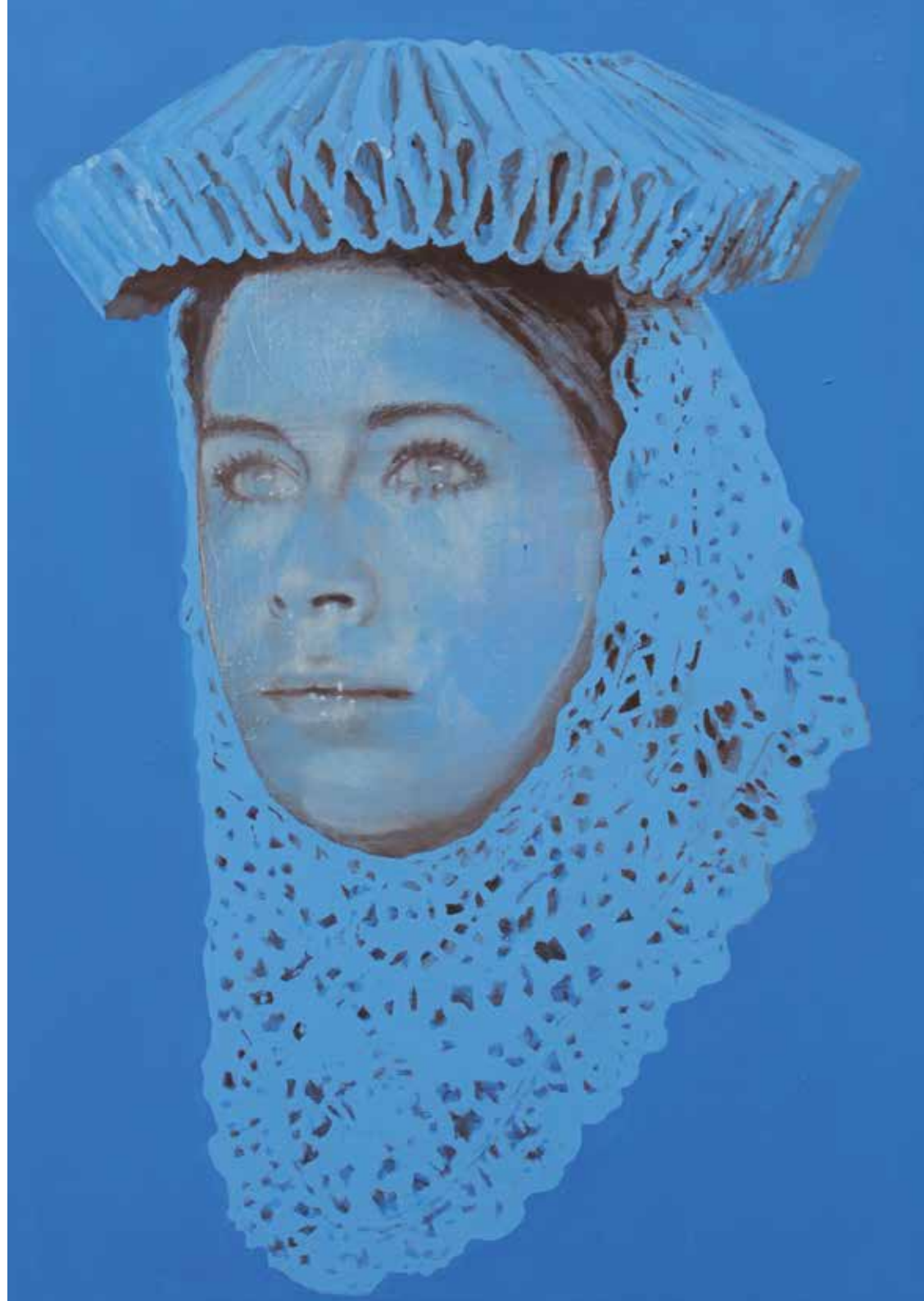
Rechts: Leave your mind, come to feel, 150 x 100 cm, 2014