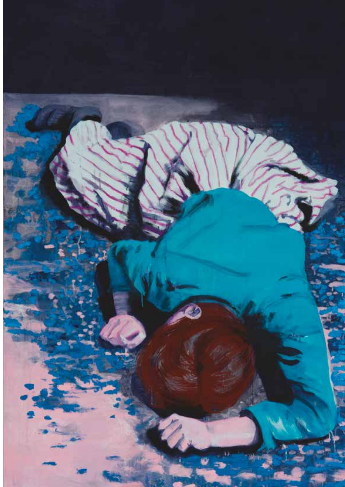
Rechts: No title, 200 x 130 cm, 2007 (collection Altrecht)