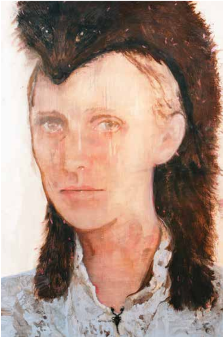
Boven: Beast of burden (triggerpoints), 150 x 100 cm, 2015