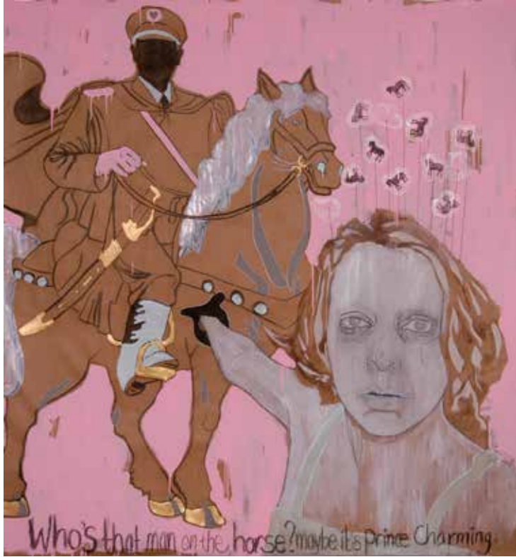
Boven: Prince charming, 236 x 219 cm, 2006 (collection Sanquin Amsterdam)