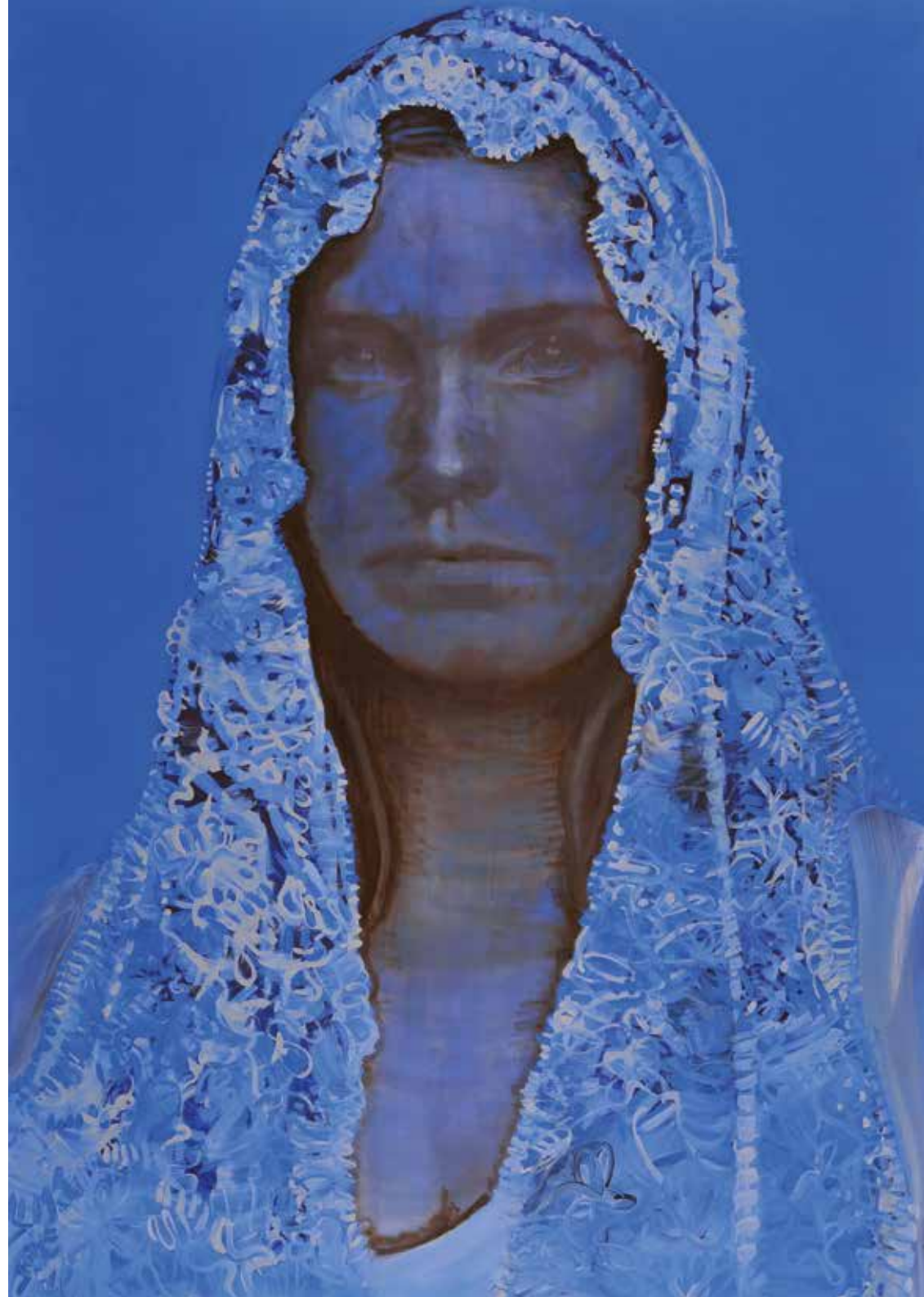
Rechts: Claiming identity, 220 x 150 cm, 2011 (private collection)