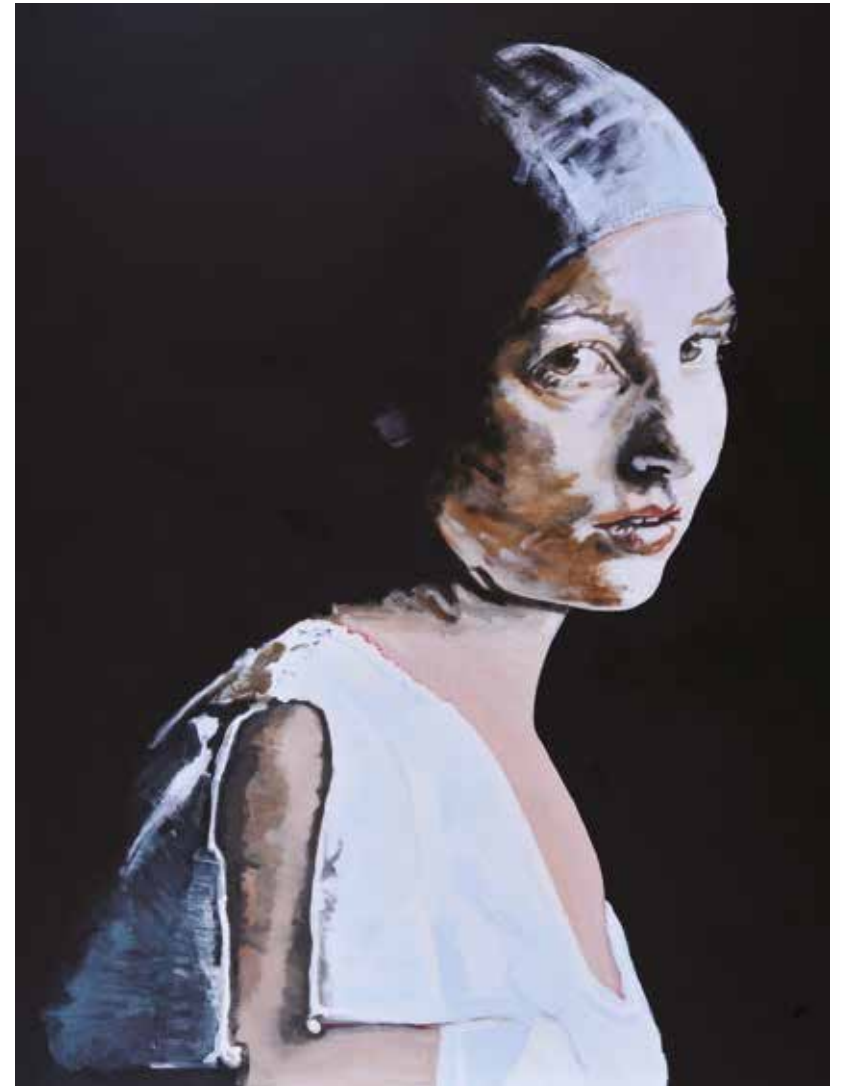
Boven: Dressed in exposure (II), 200 x 150 cm, 2010