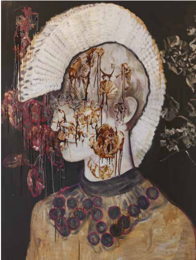
Tell the tale (to me), 200 x 130 cm, 2014