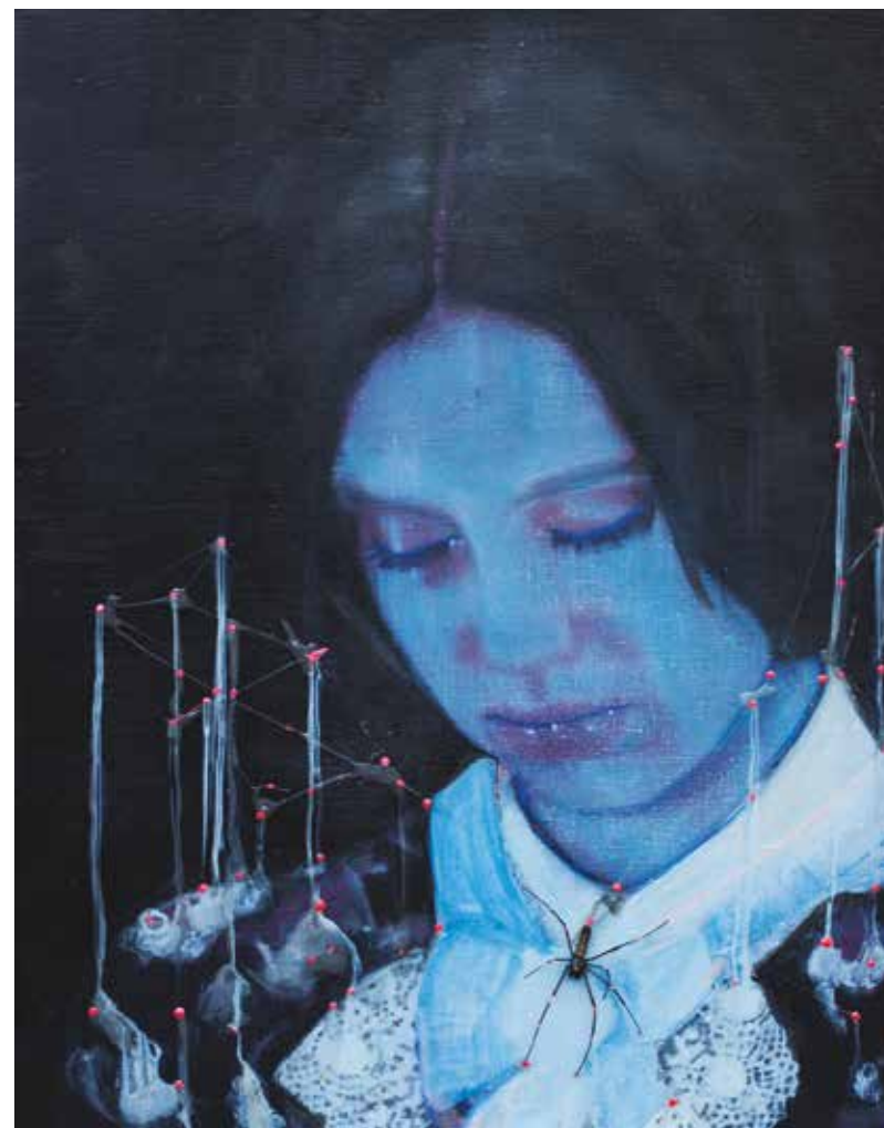
Silence we keep, 100 x 70 cm, 2015