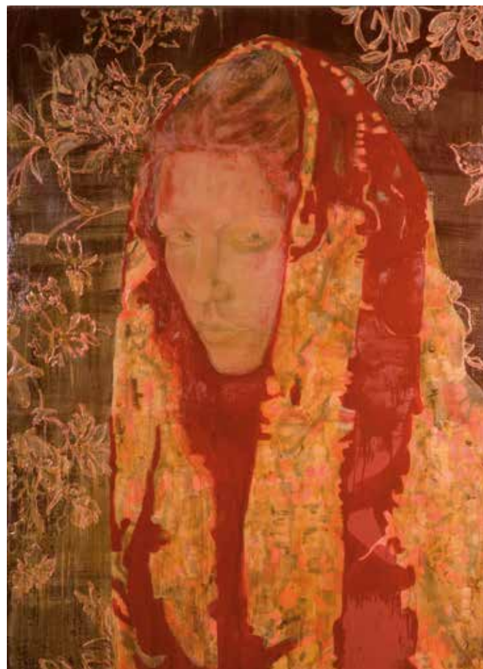
Boven: Atonement, 220 x 150 cm, 2008 (private collection)