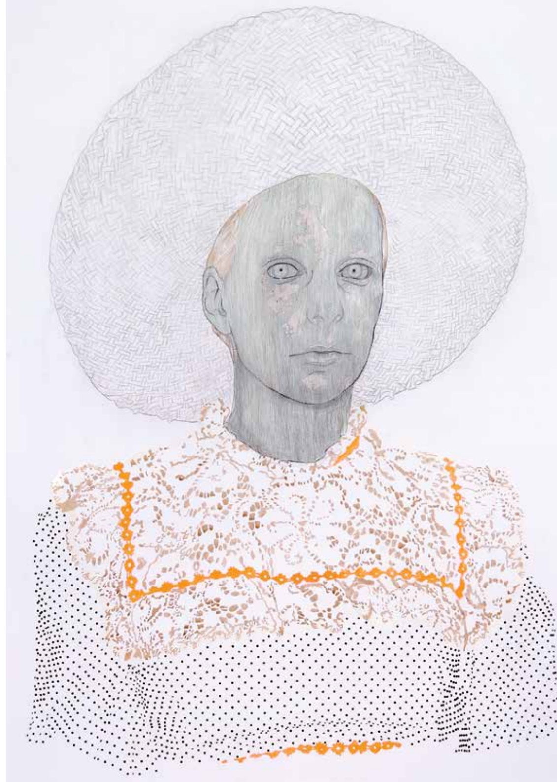
Rechts: No title, 210 x 150 cm, 2005 (private collection)