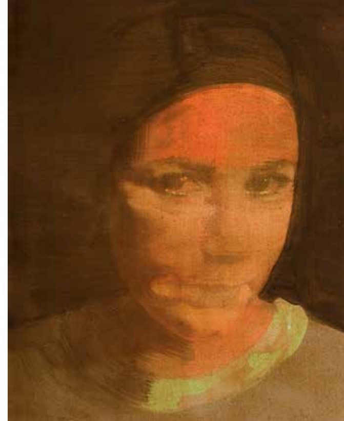
Boven: No title, 50 x 40 cm, 2008 (private collection)