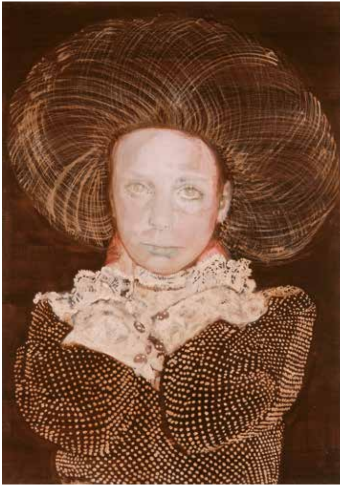
Boven: No title, 100 x 70 cm, 2008 (private collection)