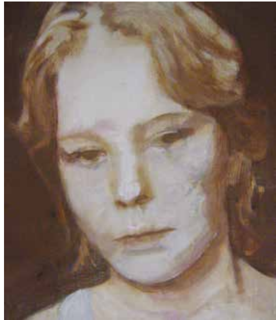
Boven: Seen it all, 40 x 40 cm, 2015 (private collection)