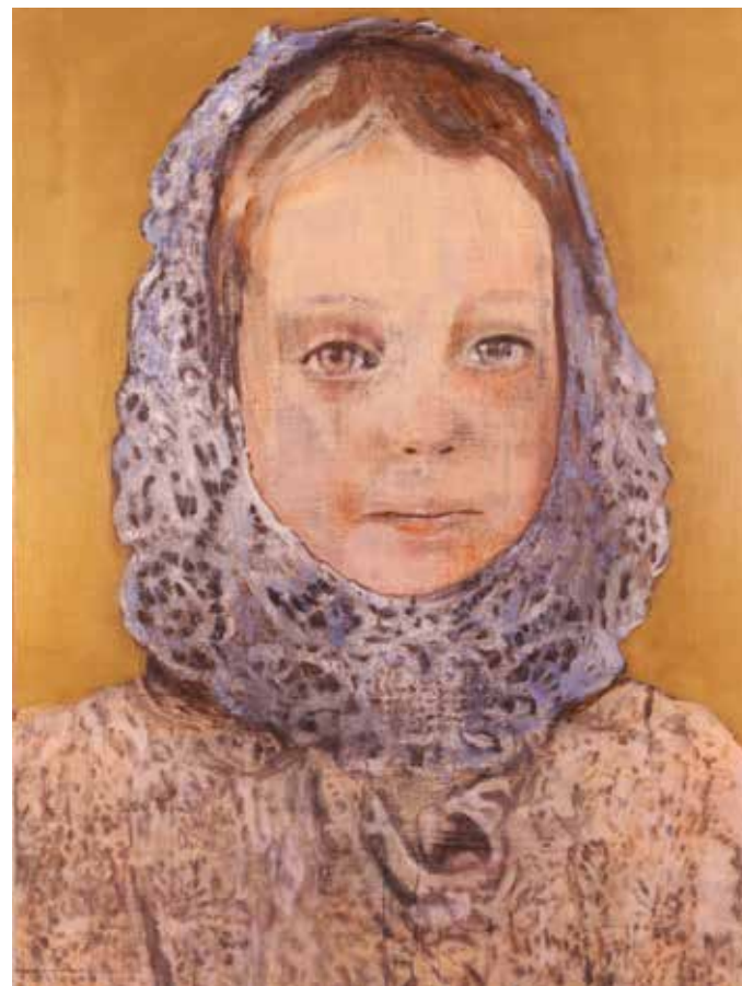
Boven: Don't leave my mind, 120 x 90 cm, 2014 (private collection)