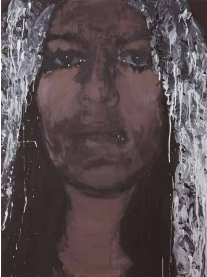
Boven: Just human, 110 x 90 cm, 2010 (private collection)