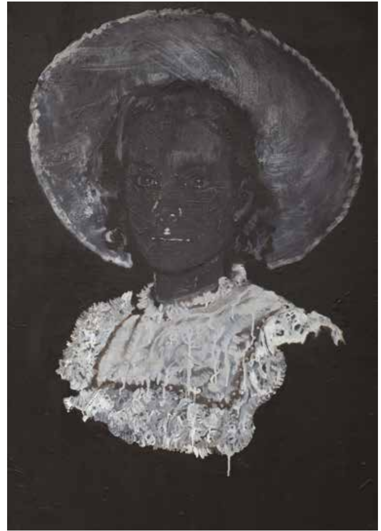
Intensity of need, 200 x 150 cm, 2010