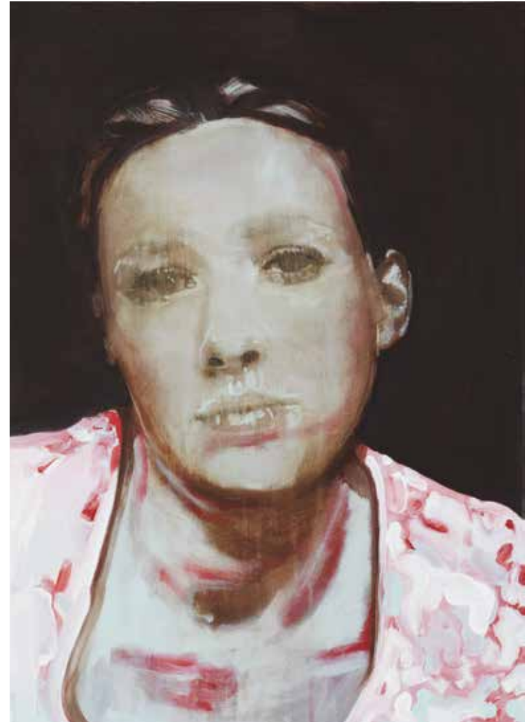
Moodshift - shift back to good again, 70 x 50 cm, 2010 (private collection)