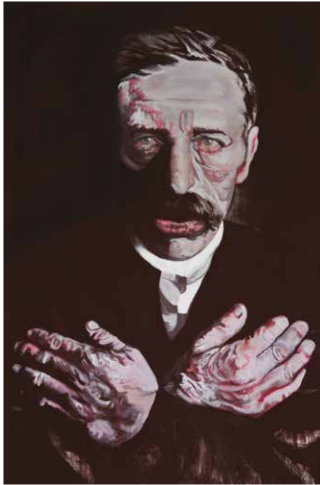
Boven: No title, 200 x 130 cm, 2007