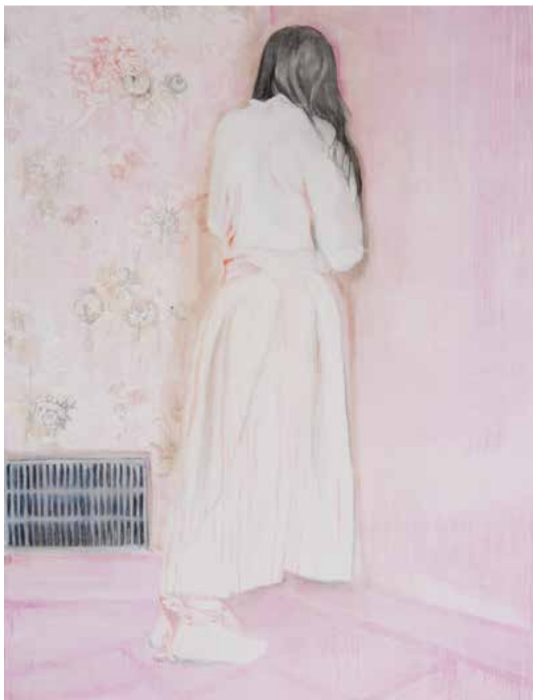
Vorige pagina: Focus on, 100 x 70 cm, 2015